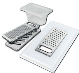
Kit grattugia con supporto per anello e vassoio di raccolta alimenti