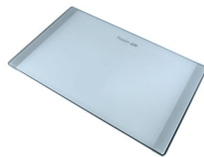
Tagliere in cristallo