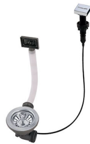
Piletta automatica LIRA 8407 102